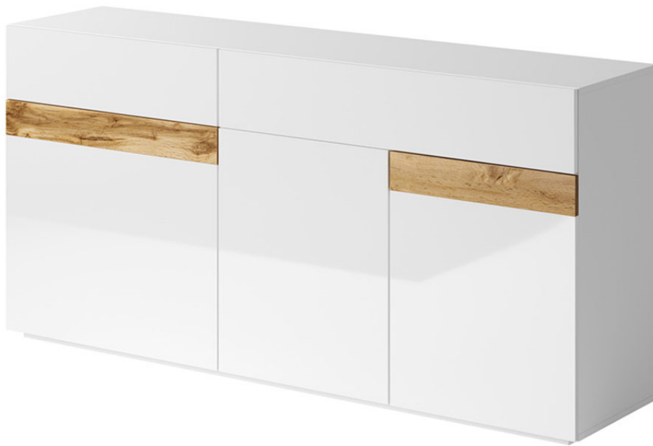
BIAŁY / BIAŁY POŁYSK - BETON COLORADO 2484IA43